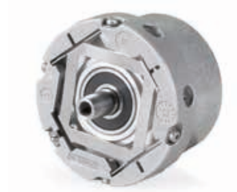
AEF/ECN/ERN 1300系列（插入式PCB）和带涨紧圈联轴器的ECN/ERN 400（电缆连接）（定子联轴器的固有频率更高）

EnDat接口（纯串行数字或模拟信号）的编码器允许读取编码器内EEPROM中保存的编码器参数和电机及制动器的特性参数值。因此，能缩短调试时间，避免在输入驱动系统参数时的输入错误。此外，EnDat编码器允许对位置进行电子调整（置零）。因此，可将编码器的绝对位置值调整到电机旋转磁场的方向位置，避免复杂的机械找正。部分编码器还提供诊断功能，例如温度计算和有效数字功能，以评估编码器的功能冗余。关键值变化时，可通过预防性措施，避免电梯的计划外维护。