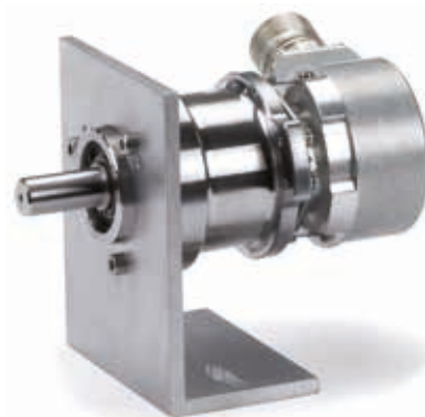
带EQN 400编码器的安装架组件 最大轴载荷： 轴向 150 N 径向 350 N

RIQ 400或带EQN 400的安装架组件特别适合用于轴定位应用。轿厢位置通过齿形带和张紧皮带轮测量。安装架组件对旋转编码器精密轴承经常承受的较大负载进行隔离，避免编码器过载。