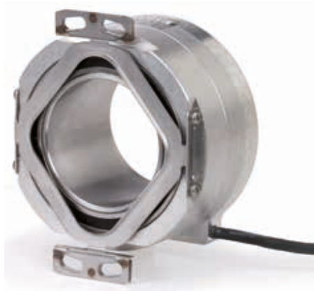
ECN/ERN 100系列 内径达50 mm的空心轴