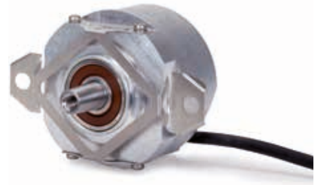
AEF/ECN/ERN 1300系列（插入式PCB）和带平面联轴器的ECN/ERN 400（电缆连接）（允许更大的运行和安装公差）