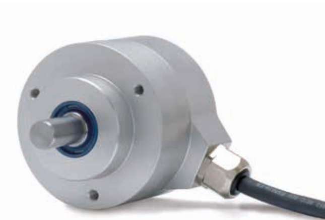
RIQ 400系列（夹紧法兰） 最大轴载荷： 轴向 100 N 径向 125 N